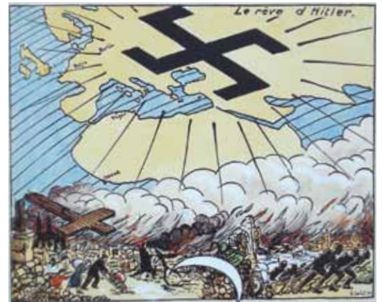
Extrait des dessins "Mamadou", 1940

Ce livre raconte la vie d'un homme, replacée dans les différents contextes qu'il a traversés : jeunesse à Marseille et Paris, enseignement dans les pays d'outre-mer, Résistant en Corrèze, préfet à la Libération, et finalement professeur de dessin et retraité à Marseille. Le « récit d'une vie » constitue le retour au pays d'une personnalité exceptionnelle, qui fut Résistant, citoyen engagé et artiste.