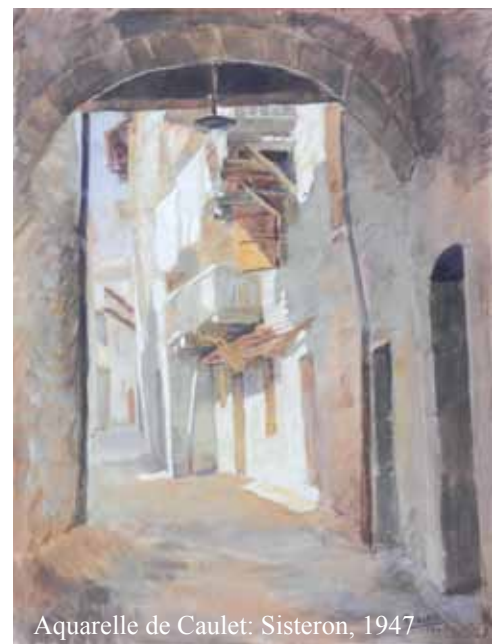
Aquarelle de Caulet: Sisteron, 1947

Bruno Kartheuser – Violinstr. 12 Neundorf – 4780 St.Vith Belgique – www.krautgarten.be – bruno.kartheuser@skynet.be