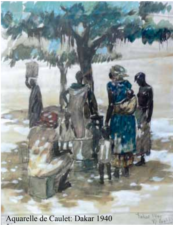
Aquarelle de Caulet: Dakar 1940