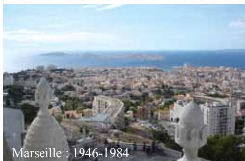
Marseille : 1946-1984